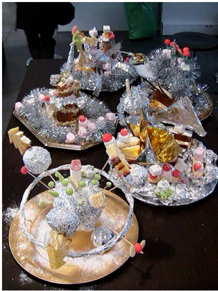
Space christmas cake MAC/VAL, 2007

Elle proposera aux enfants un atelier mêlant les matériaux traditionnels de l'art et ceux de la gastronomie pour la création d'œuvres hybrides entre art plastiques et nourriture : sculptures en crème Chantilly, dessins au jus de betteraves, tableaux en sauce tomate ! Elle proposera d'inventer une vraie cuisine de l'art et de réaliser une édition aux airs de fiches recettes, en écho à l'accrochage de la collection, mettant en valeur la peinture et la chimie des matériaux.