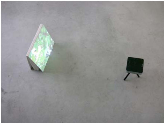
D'une maison à l'autre , 2012, Bruxelles.

L'artiste invite à participer à la création d'une vidéo collective. Chaque jour, les différents participants découvriront une des étapes de la réalisation vidéo en passant par l'écriture, le dessin, la construction de décors et le tournage. Lors de la restitution, le mélange des multiples univers et médiums utilisés apparaîtra et prendra sens au sein d'une œuvre commune.