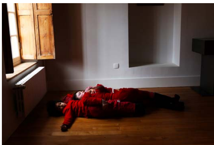
Corps de masse , mars 2013, Musée d'art et d'histoire de Saint-Denis.

Corps de masse est un projet né d'ateliers menés au Musée d'art et d'histoire de Saint-Denis, installé dans un ancien carmel. Halida Boughriet a filmé des habitants de la ville, en rupture sociale, familles, jeunes, invités à se rassembler, à s'enlacer et à faire corps devant la caméra, avant de se séparer lentement. Les participants seront mis en situation pour créer une œuvre collective au croisement de la danse, de la performance et de l'image en mouvement.