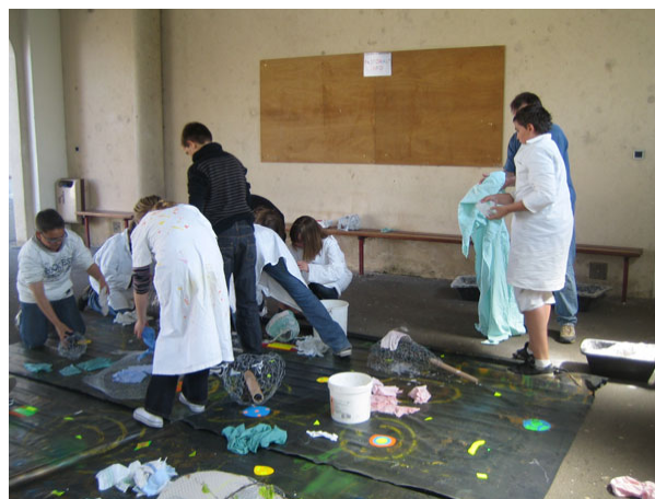
Ateliers Les Avenirs , 2009.