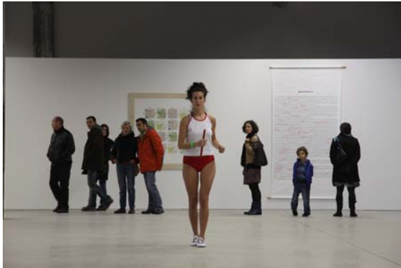
Passer le temps , 2011, Hangar à Bananes, Nantes.

L'atelier se déroulera hors les murs, dans la galerie commerciale République de Bonneuil.