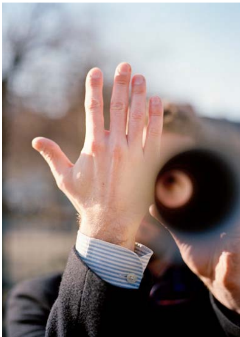
Hard Rain , 3-25 mai 2014, Simultanhalle.

Inspirés par une vidéo de l'artiste, les participants sont invités à créer des images animées à partir de peintures, pellicules vidéo, dessins, etc. Le projet proposé par l'artiste pour le MAC/VAL sera nourri de sa pratique habituelle et poétique de l'image en mouvement pour réaliser avec les participants des oeuvres aux allures de tours de magie.