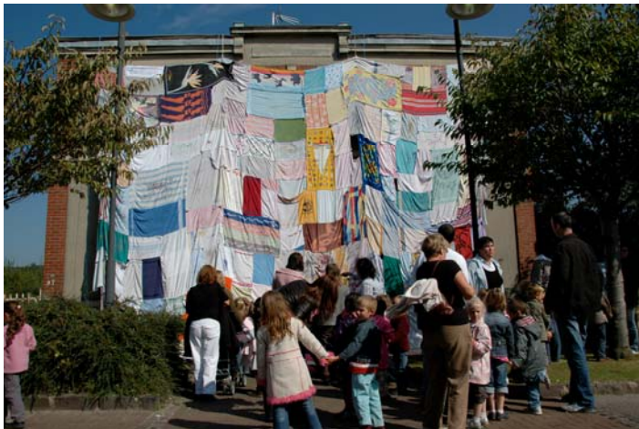
Rencontre , atelier 880, Arques-La-Bataille, 2008

Mario d'Souza proposera aux enfants un atelier où la chaise la plus simple, celle de la salle de classe ou de la salle d'attente, sera l'élément principal associé à la mousse, matériau souple et presque vivant, pour un travail d'assemblage et d'installation in situ , partant des principes de la sculpture et de l'installation.