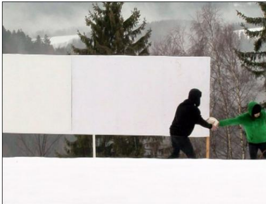
Paint for Hochwechsel , WATP 2010 http://vimeo.com/43800828

Les artistes mèneront la réalisation d'une fresque collective par les habitants de Bonneuil. Cette expérience sera filmée et diffusée lors d'une restitution au musée en septembre. L'expérience sera nourrie par une visite du MAC/VAL comportant une projection de vidéos d'artistes sur le thème « démolition/construction ».