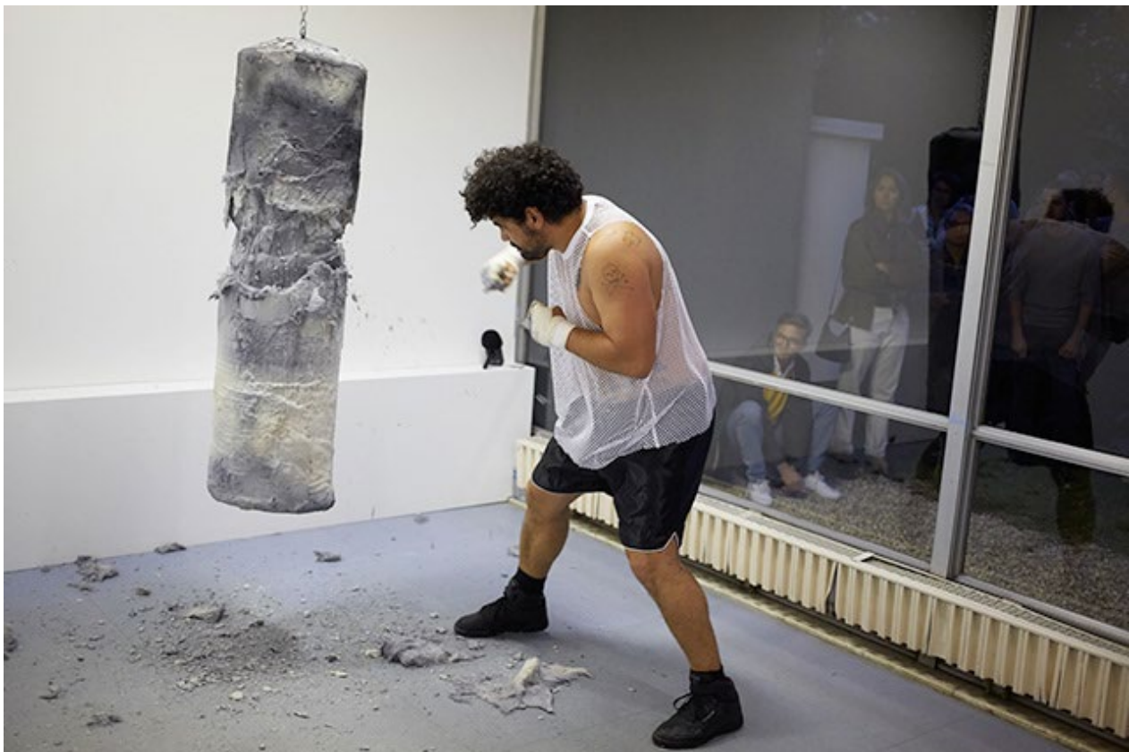
Vues de la performance Frapper / Creuser, 2016

La pratique de Yoan Sorin se décline selon des mythologies qu'il actualise à mesure de dessins et d'installations, de peintures ou de performances. À la manière du journal de bord et de ses multiples carnets de dessins, il conjugue la prise de note et la confection d'objets qui se présentent comme autant de rébus ou d'aphorismes, lieux de collusions des représentations.