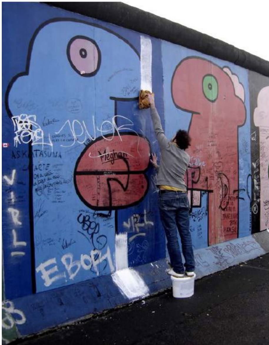
Tentative de repeindre le mur de Berlin avortée par un citoyen allemand Photographie, 30x24 cm. 2008

Né en 1972 à Skikda en Algérie, Fayçal Baghriche s'interroge sur la place de l'artiste dans l'espace social ainsi que les symboles collectifs. Sa démarche artistique révèle la poésie et l'étrangeté des pratiques quotidiennes et les stéréotypes tacites qui codifient les échanges entre individus. Il travaille à partir de gestes simples et d'objets facilement reconnaissables.