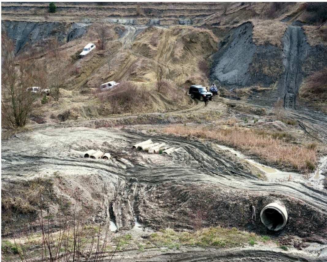
Mont Verdun, Terrain de 4 × 4, La course, 2010 | Photographie argentique, impression numérique | Courtesy de l'artiste © Anne-Lise Seusse

[Extrait de http://www.attrape-couleurs.com/artistes/anne-lise-seusse/ ].