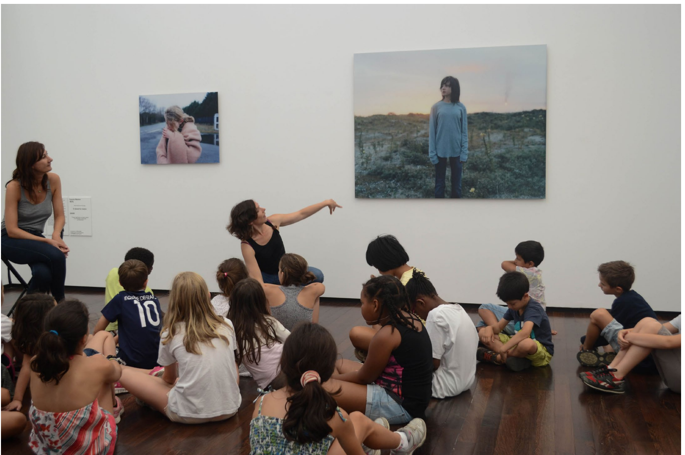
Atelier-parcours avec l'artiste Laura Henno. Portes du temps 2016

Le visiteur est accompagné dans sa visite par plusieurs outils, à la fois ludiques et pédagogiques, qui le placent au plus près des artistes et de la création vivante.