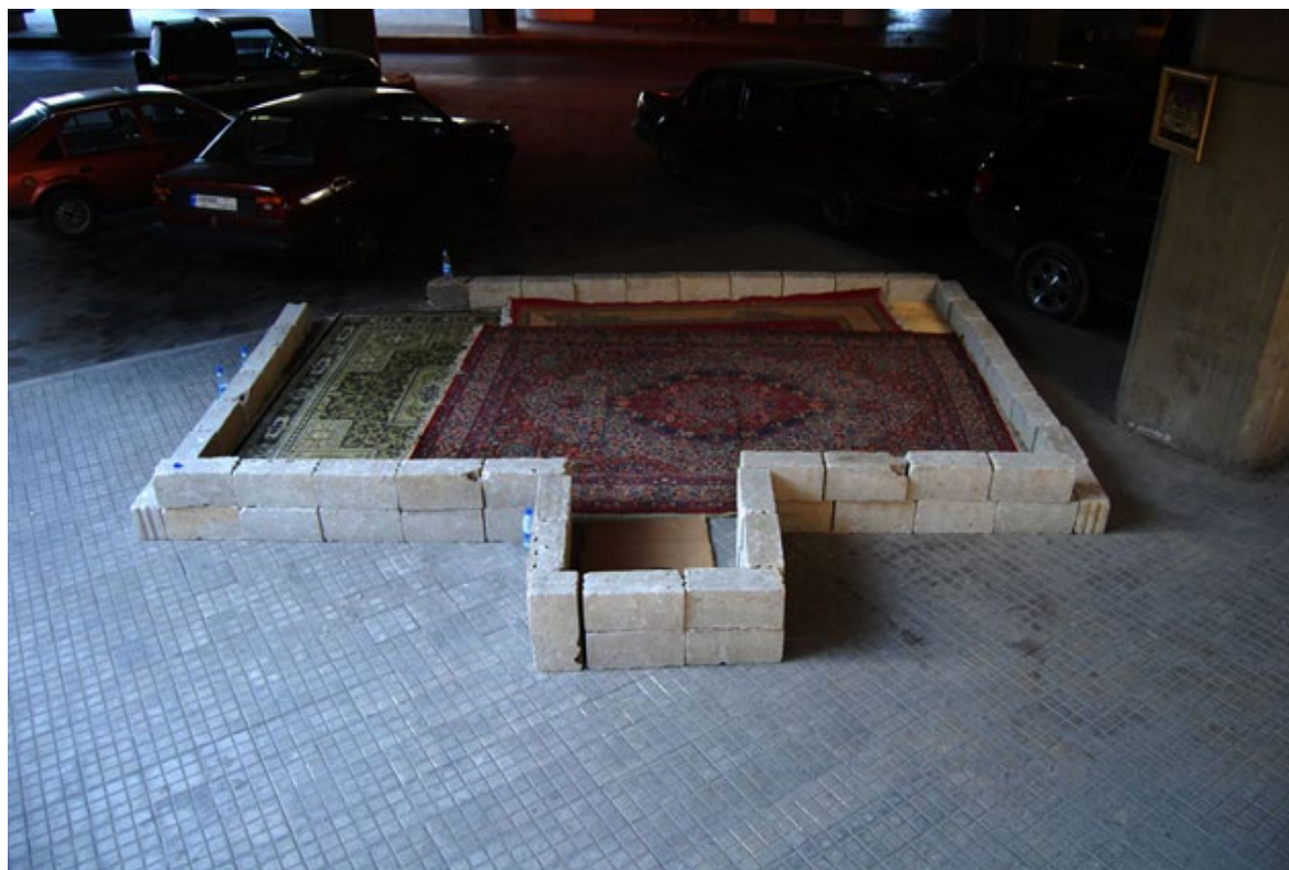
Espace public - Territoire privé, 2011, Impression numérique sur aluminium, 120 x 80 cm

2009 : Diplôme National d'Art Plastique, École Nationale Supérieure des Beaux-Arts de Paris