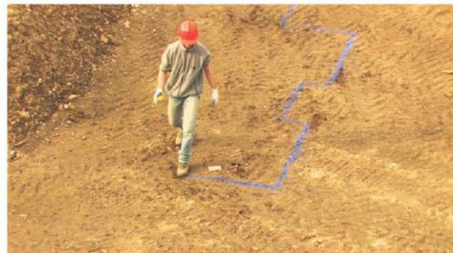
Proposition pour un musée sur une île déserte, 2009. vidéo HD