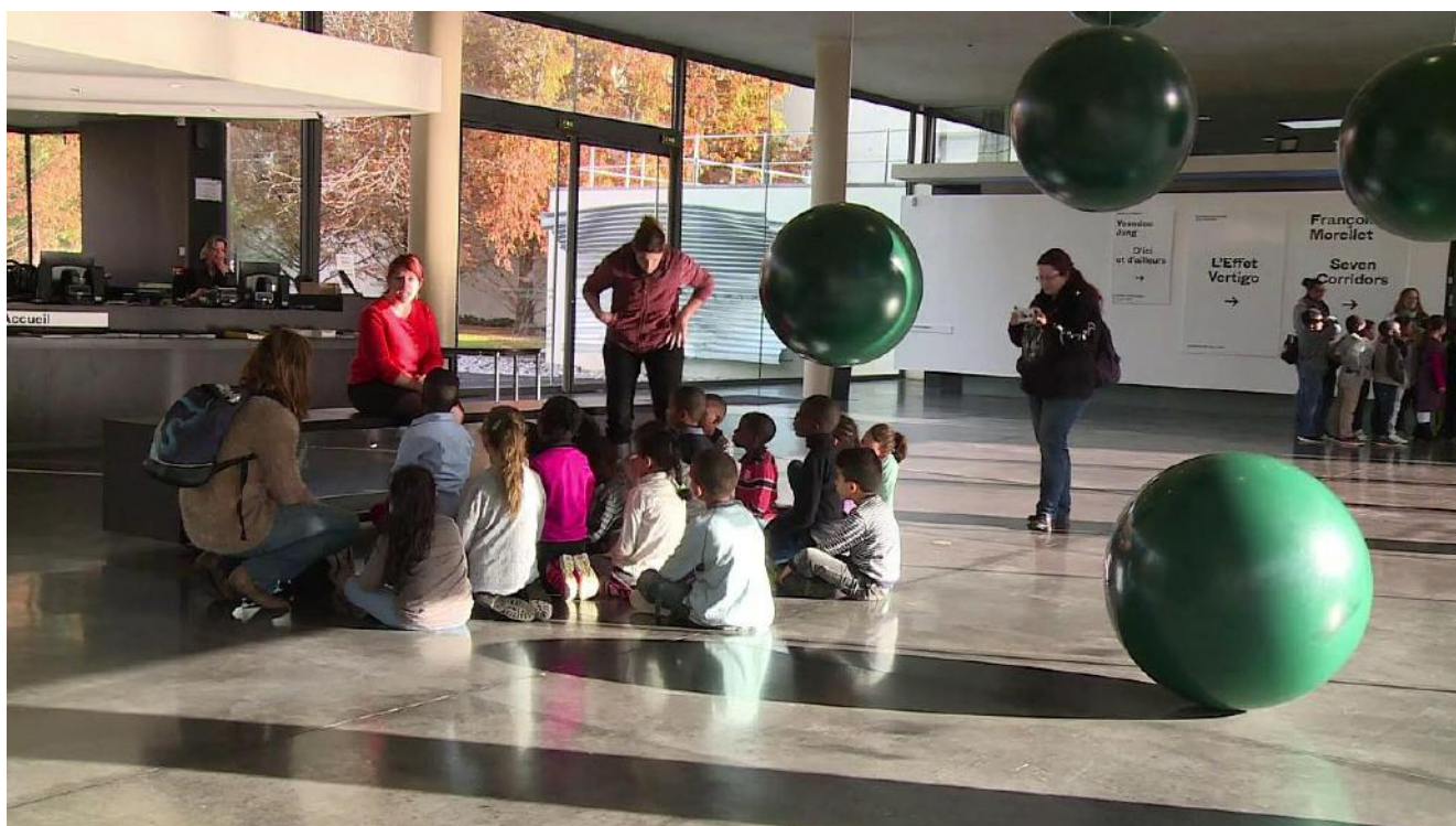
Sur l'image, détail de l'œuvre de Xavier Veilhan « Mobile n°26 », 2015.

Pour son dixième anniversaire, le MAC VAL propose au public de revenir dans le temps afin de s'interroger sur sa mission qui est de relier le passé et le présent, et d'effectuer un arrêt sur image pour mieux envisager le futur à venir, celui à construire. Les quelque 70 artistes réunis dans « L'Effet Vertigo » portent un regard de l'autre côté du présent, relisant, jouant ou réinterprétant les faits historiques, les ramenant ainsi à la lumière d'aujourd'hui. Le parcours est organisé en relectures historiques, constitutions d'archives personnelles, interrogations des rites, fabrications de reliques, interprétations scientifiques et réemplois d'objets. Car l'artiste est inscrit dans l'histoire, l'histoire de l'art bien sûr, mais plus encore celle qui nous est commune, l'Histoire humaine, celle des conquêtes, des accords de paix, des progrès technologiques, des avancées médicales, des idéaux politiques, des modes de gouvernance... Acteur et témoin de l'histoire, l'art s'envisage aussi comme archéologie, voire fabrique du savoir.