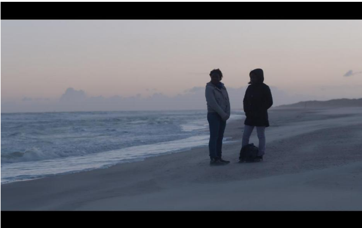
Extrait du film Missing Stories , commande publique du Centre national des arts plastiques © Laura Henno

Le film raconte l'histoire de jeunes migrants, réunis sur un territoire sans repères, entre mer et désert, rejouent ensemble leur arrivée en France. Des fragments de vie se croisent et esquissent un récit commun, celui « générique » qui leur est vendu par les passeurs. Les non dits et les secrets contraignent ces jeunes, leur histoire délivrée à l'institution étant déterminante pour pouvoir rester. La fiction peut devenir alors une stratégie de survie.