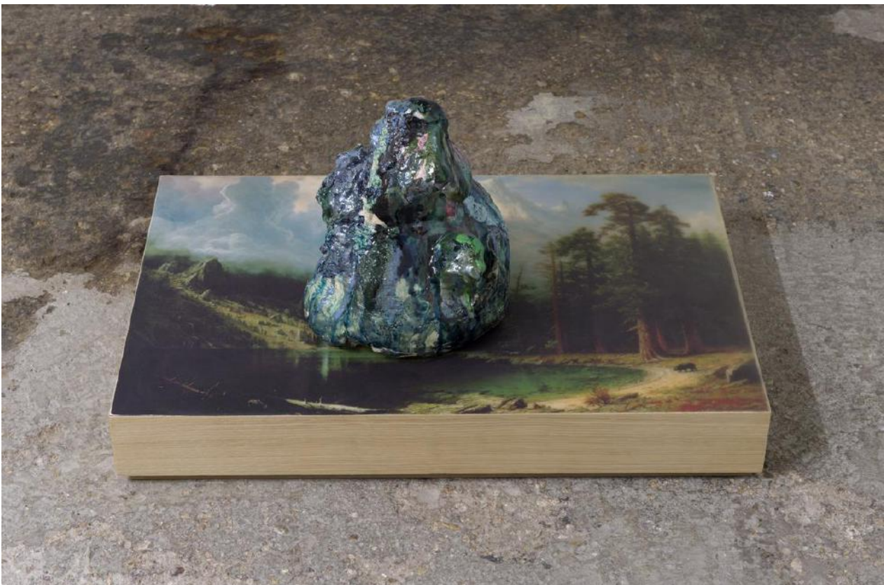
Loch Ness, 2012. Faïence émaillée, impression contrecollée sur bois, résine.

Considérant un monde de potentialités, provisoire, où toutes les possibilités restent ouvertes, elle tend à privilégier l'accident et l'imprévisible comme processus de création.