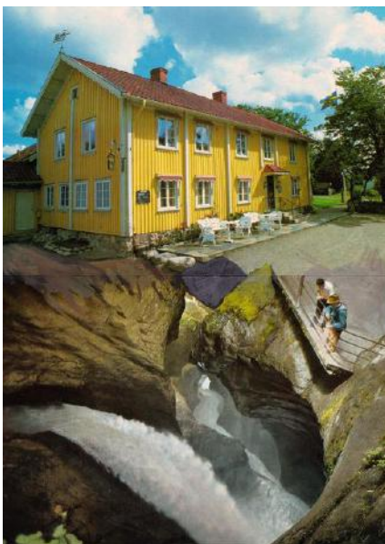
Pierre Ardouvin, La maison jaune, 2016 Série « Écran de veille ». Impression sur toile, résine, paillettes et cadre — 176 × 234 cm Production MAC VAL — Musée d'art contemporain du Val-de- Marne. Photo © Pierre Ardouvin. © Adagp, Paris 2015.

transformable, association créée en 2012, a pour but de produire et promouvoir des projets aux croisements de différentes disciplines artistiques. Tous ont pour point commun d'être un lieu d'expression inattendu pour des artistes trop facilement cantonnés à un seul domaine, dont la sensibilité artistique en dépasse pourtant les frontières. www.transformable.com