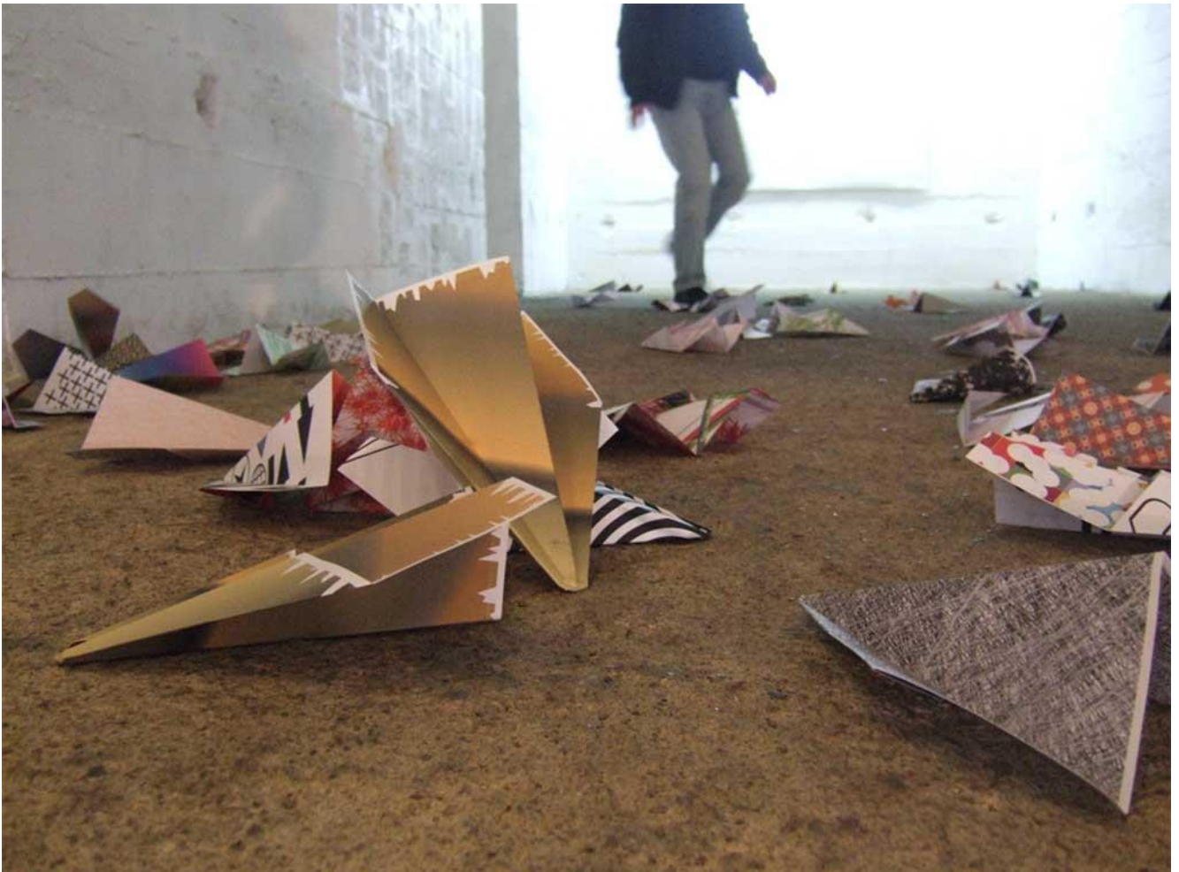
Air Lines, 2008

À partir d'une pratique picturale fondée sur la grille s'inscrivant dans l'architecture, Éric Gouret travaille autant la bidimensionnalité (rubans adhésifs collés en compositions abstraites) que le relief. Il se confronte au contexte de l'espace public à travers des installations in situ.