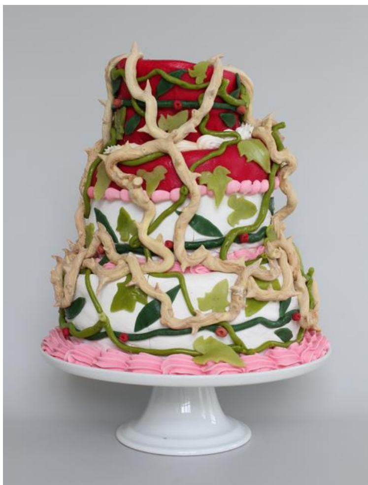
Poison Ivy, 2012.

d'art dont il questionne le statut culturel, social ou économique. En pratique, l'artiste n'affiche aucune forme d'expression privilégiée, passant allègrement de l'affichage public à la vidéo, du papier peint aux arts graphiques, de la photographie à des objets aussi saugrenus qu'un gâteau de pâtisserie.