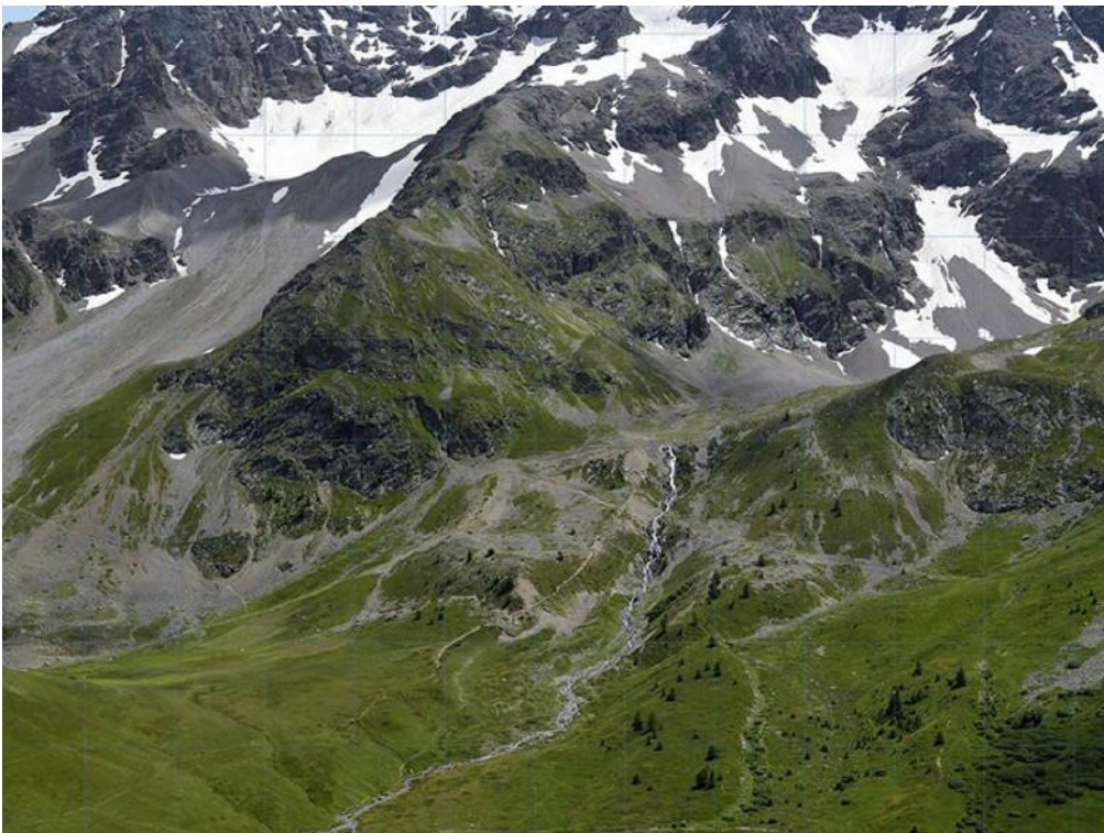
Morgane Denzler, Cartographie 4, 2014, Tirage numérique plié, 96 x 120 cm, Edition : 3 + 1 EA, Courtesy of the artist and Bendana | Pinel Art Contemporain

Comment amener l'ailleurs à l'intérieur de l'espace du musée ? Comment transmettre des histoires personnelles à travers des paysages ? L'atelier propose de construire au fil des jours un paysage/décors dans une seule et même salle. Un paysage dont l'élaboration est portée par nos récits et ceux des participants de l'atelier. Des photographies de Morgane Denzler, paysages grands formats imprimés sur papier peint, recouvriront progressivement les murs. Les participants seront invités à intervenir sur ces photographies en racontant et en dessinant des histoires autobiographiques que leur évoquent ces paysages. Ce dispositif narratif est au centre de la pratique artistique d'Emma Cossée. Chaque jours des outils différents (feutres posca, objets, plantes, cartes) permettront d'aborder autrement l'espace. En engageant le corps et la voix des participants, l'atelier propose de construire ensemble un paysage qui soit la somme des récits autobiographiques des participants.