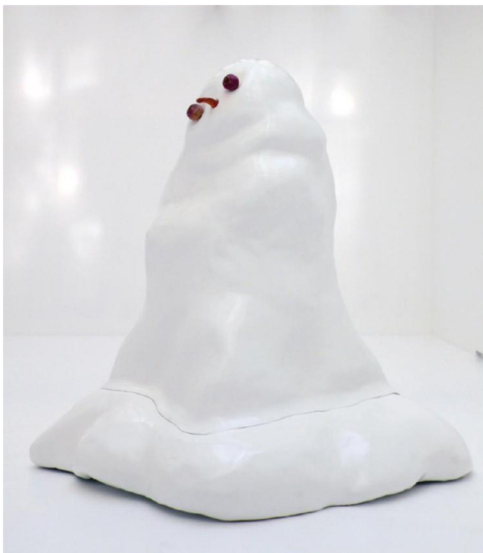
Pierre Ardouvin, Le bonhomme de neige (4) , 2007. Résine, 160x167x177cm, 4/5

Pierre Ardouvin développe un univers fictionnel ancré dans un regard de biais sur le réel. Pour ce nouveau projet, il s'empare de l'espace dévolu aux expositions temporaires en un geste global rassemblant œuvres et scénographie. Les temps se mêlent, entre productions nouvelles et œuvres réactivées en un parcours glam'onirique et poétique. Le titre « Tout est affaire de décor » transforme ainsi l'exposition en une scène mélancolique et métaphysique que le visiteur est amené à arpenter et à recomposer. L'exposition devient un véritable paysage mental, où les œuvres assemblées, rejouées, sont autant d'embrayeurs narratifs. Une angoisse sourde s'installe dans une ambiance feutrée. Quelque chose d'imminent flotte, étrangeté familière et inquiétante, suspendant ainsi les certitudes, le temps linéaire, le Spectacle et sa coupure nécessaire.