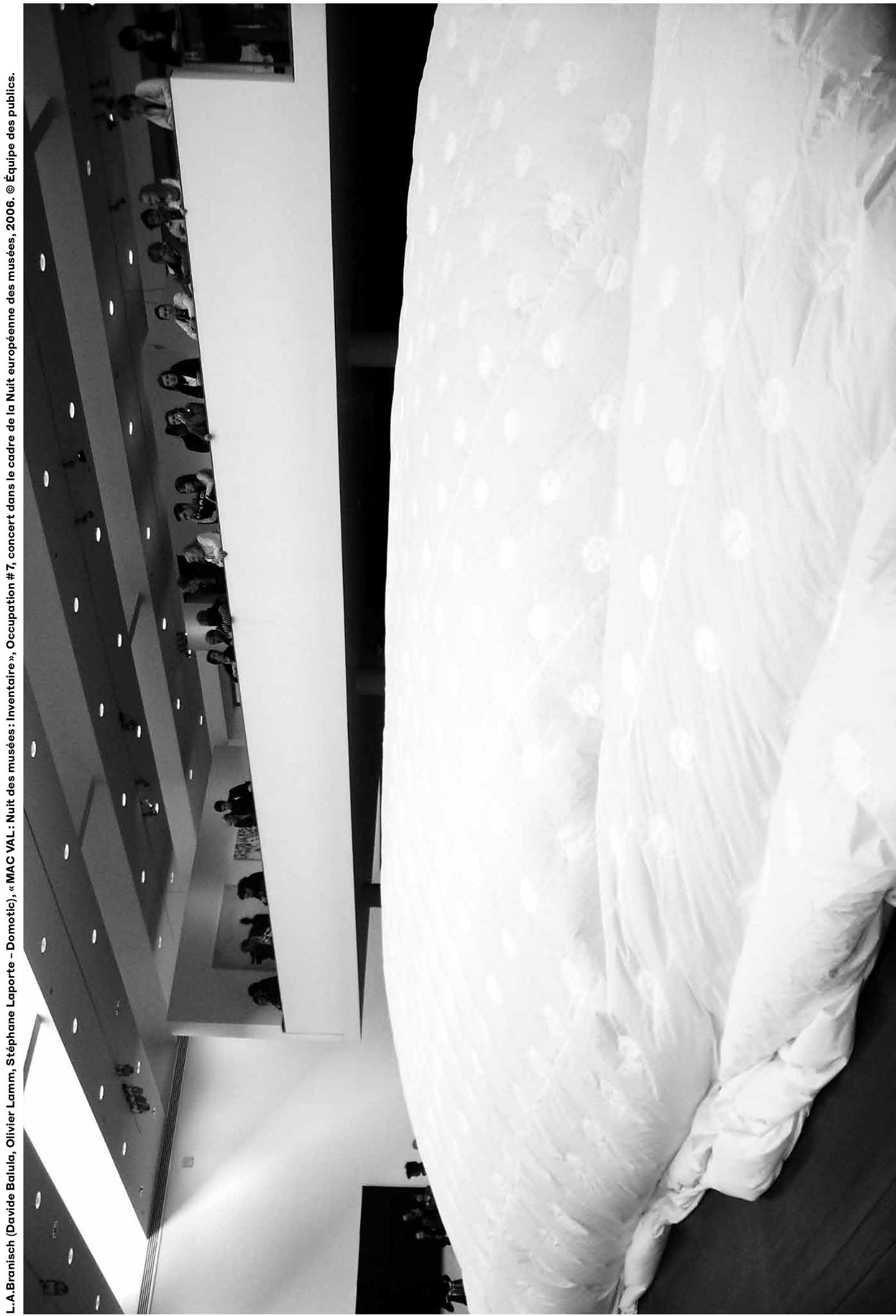
L.A.Branisch (Davide Balula, Olivier Lamm, Stéphane Laporte - Domotic), «MAC VAL: Nuit des musées: Inventaire», Occupation #7, concert dans le cadre de la Nuit européenne des musées, 2006.