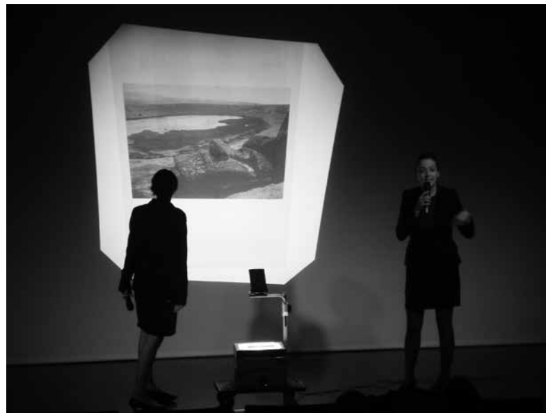
3 Guillaume Désanges, « Une histoire de la performance en 20 minutes », conférence imaginaire, Compagnonnage critique Guillaume Désanges, 2006.